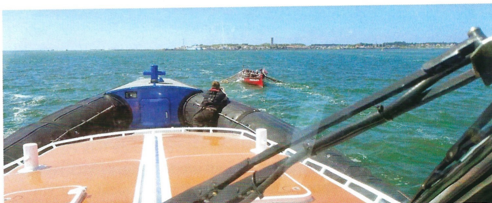
Het laatste stukje naar huis op eigen kracht

Aan alles komt een einde en zo ook aan dit verhaal. Wij hebben een leuke en sportieve tijd met elkaar gehad en wie weet roeien we nog wel weer een keer een tochtje... (Texel?)