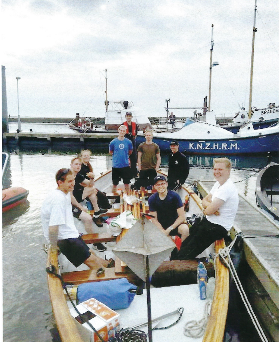
Zaterdagochtend 05:15 klaar voor vertrek

De sfeer zat er goed in en zo ook de vaart. Een uur na vertrek passeerden we de Oosterom 18 boei; we lagen prima op schema. Ter hoogte