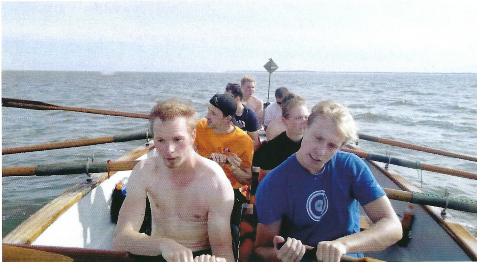
Ameland komt in zicht, de vermoeidheid slaat toe