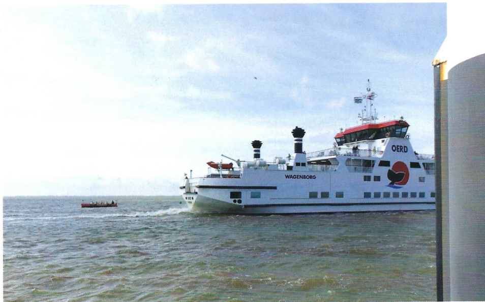
Aanloop haven Ameland, we zijn er bijna