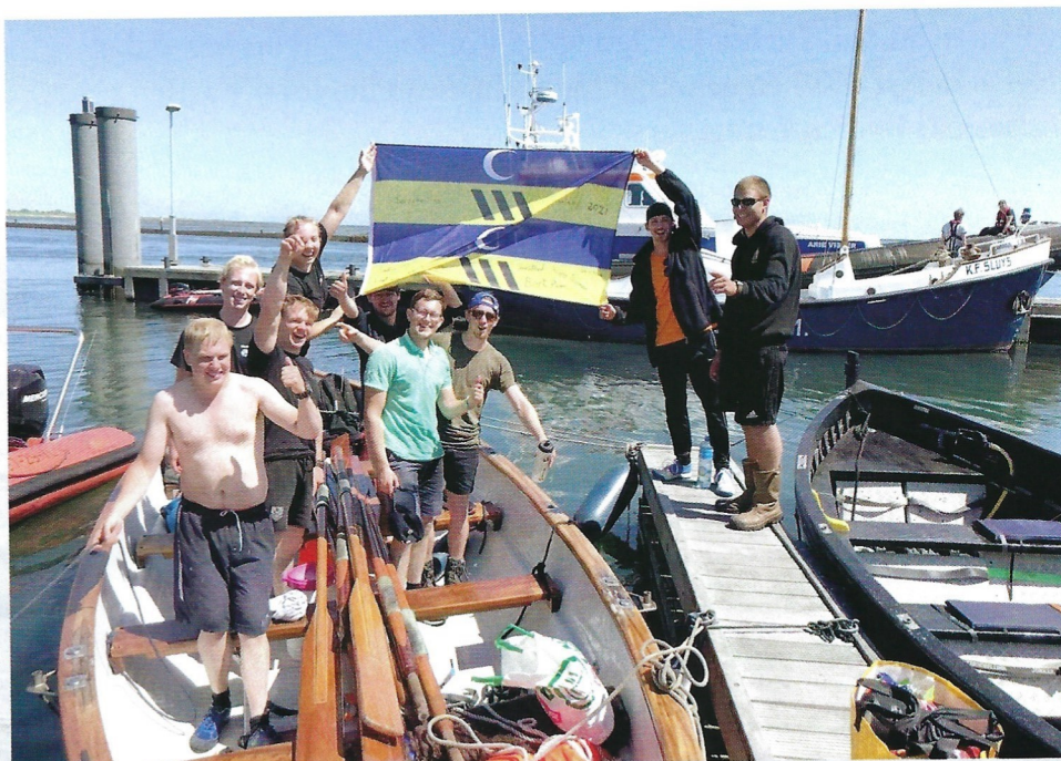
Het avontuur zit erop! De namen vereeuwigd op de vlag, negen trotse roeiers