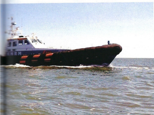
ons wel verder slepen