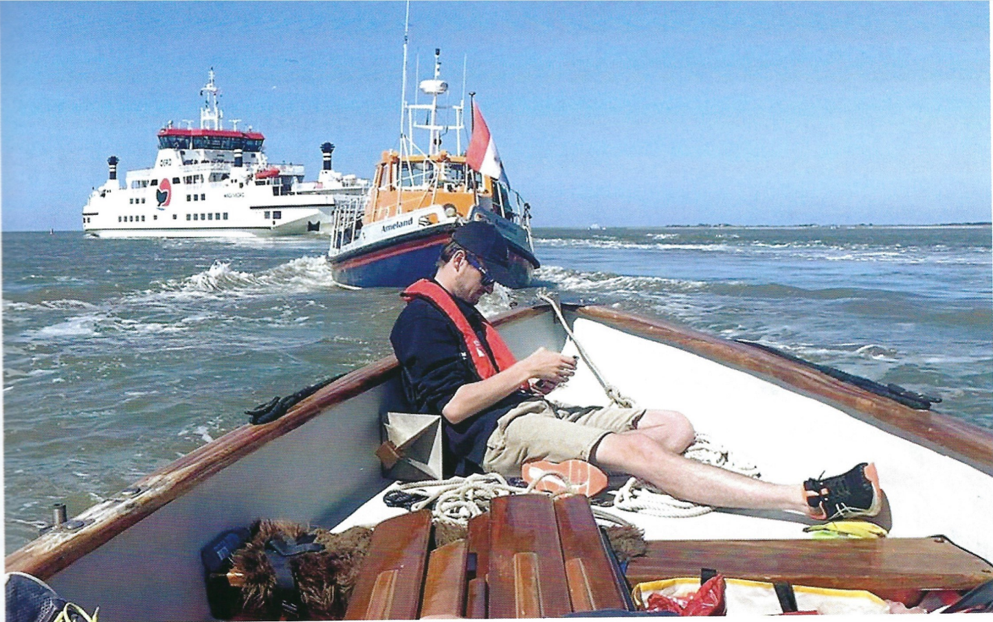
Op naar huis, een sleepte tot aan de Oosterom boei 50

Omrop Fryslân en Omroep Lennard, voor het maken van de filmpjes en interviews. De schipper van de 'Highlander' van Ameland. De bemanning van de 'Arie Visser', voor hun assistentie.