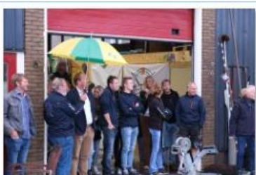
04. publiek tewaterlating Skomskiff