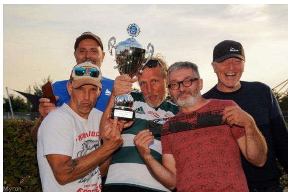
Martin's Dream Team (MDT) open heren team uit Woudrichem