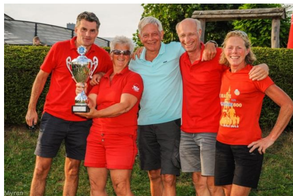
Niekarkers Mixed 50+ team uit Nijkerk