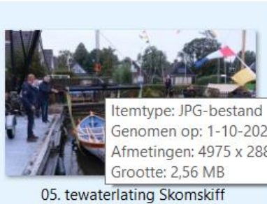
05. tewaterlating Skomskiff