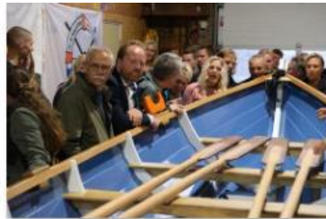
02. bewonderaars Skomskiff