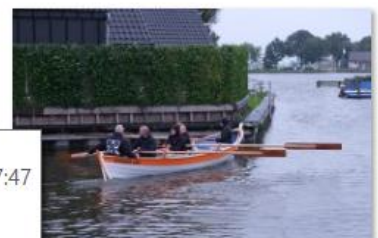
06. eerste vaart Skomskiff

Niet alleen in Oudega werd er afgelopen maanden een st Ayles skiff gedoopt, ook in Giessen Rijswijk (de vijf Zalmen) en in Den Helder werden 2 skiffs gedoopt.