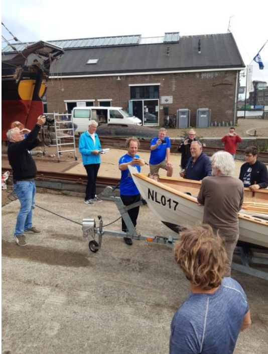
Den Helder Scholen aan Zee