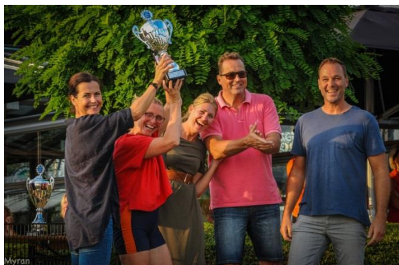
Batavieren Mixed open team uit Woudrichem

Op basis van deelname en tijden is er voor 2021 in 3 categorieën een Nederlands Kampioen 2021 uitgekomen: