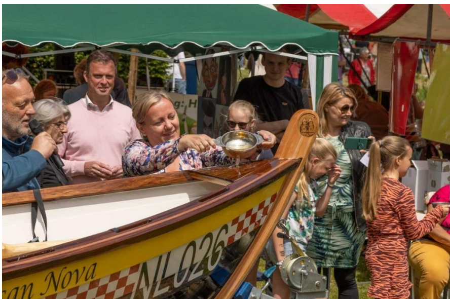
Doop door de wethouder

Inmiddels is de Roeivereniging Dussen in korte tijd uitgegroeid naar rond de 35 leden, 15 proefleden en een ligplaats aan de rand van de Biesbosch. Met een eigen website, nieuwsbrief en afspraken over veiligheid. Enorm goed bezig dus!