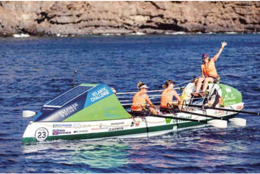
Links: Atlantic Dutchesses bij het vertrek uit La Gomera.