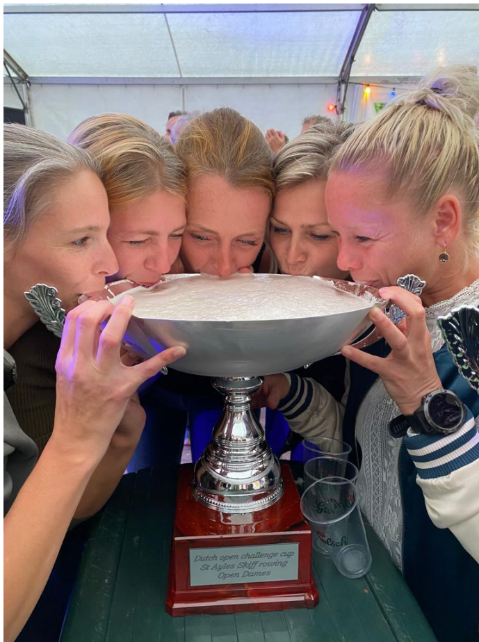
Batavieren dames open kampioensteam met de welverdiende wisselbeker!